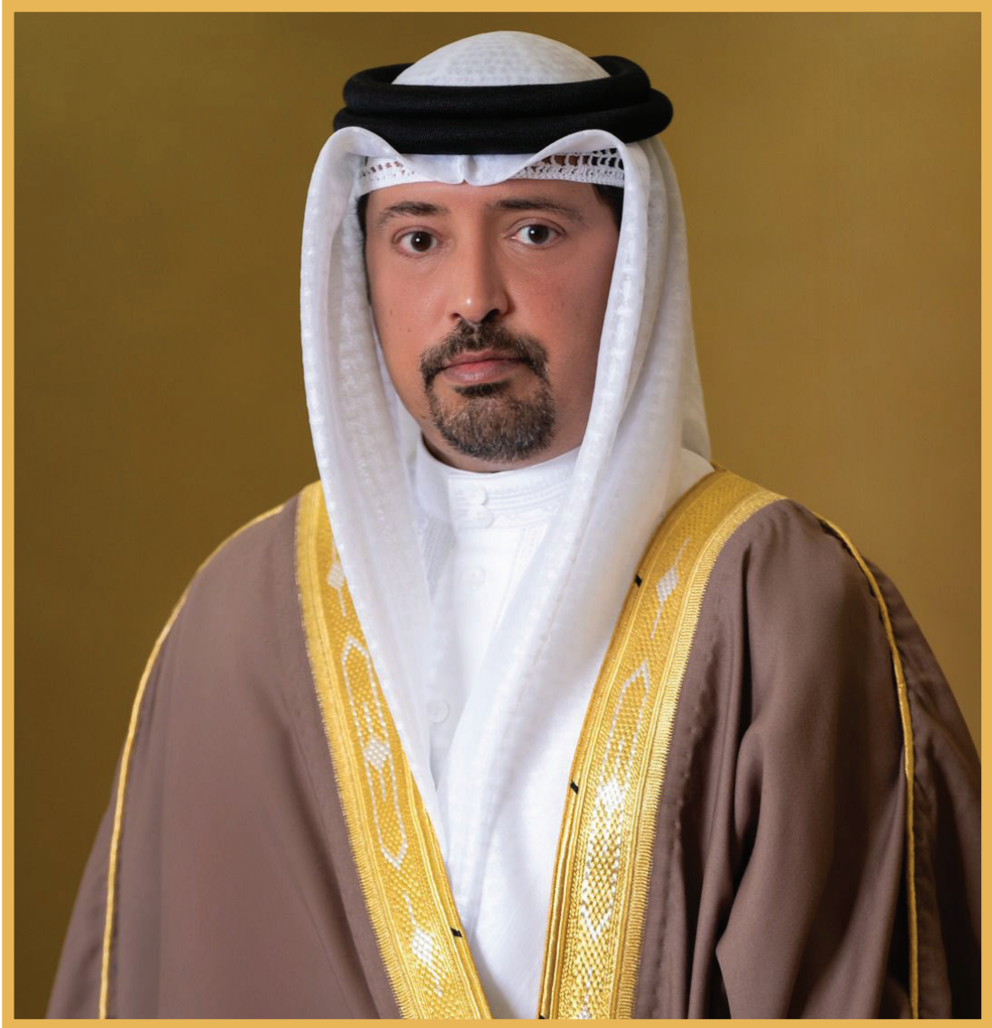
أحمد بن حمد آل خليفة رئيس الجمارك