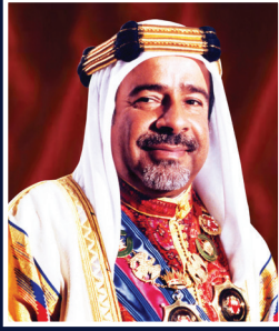
المغفور له بإذن الله تعالى الشيخ عيسى بن سلمان آل خليفة طيب الله ثراه