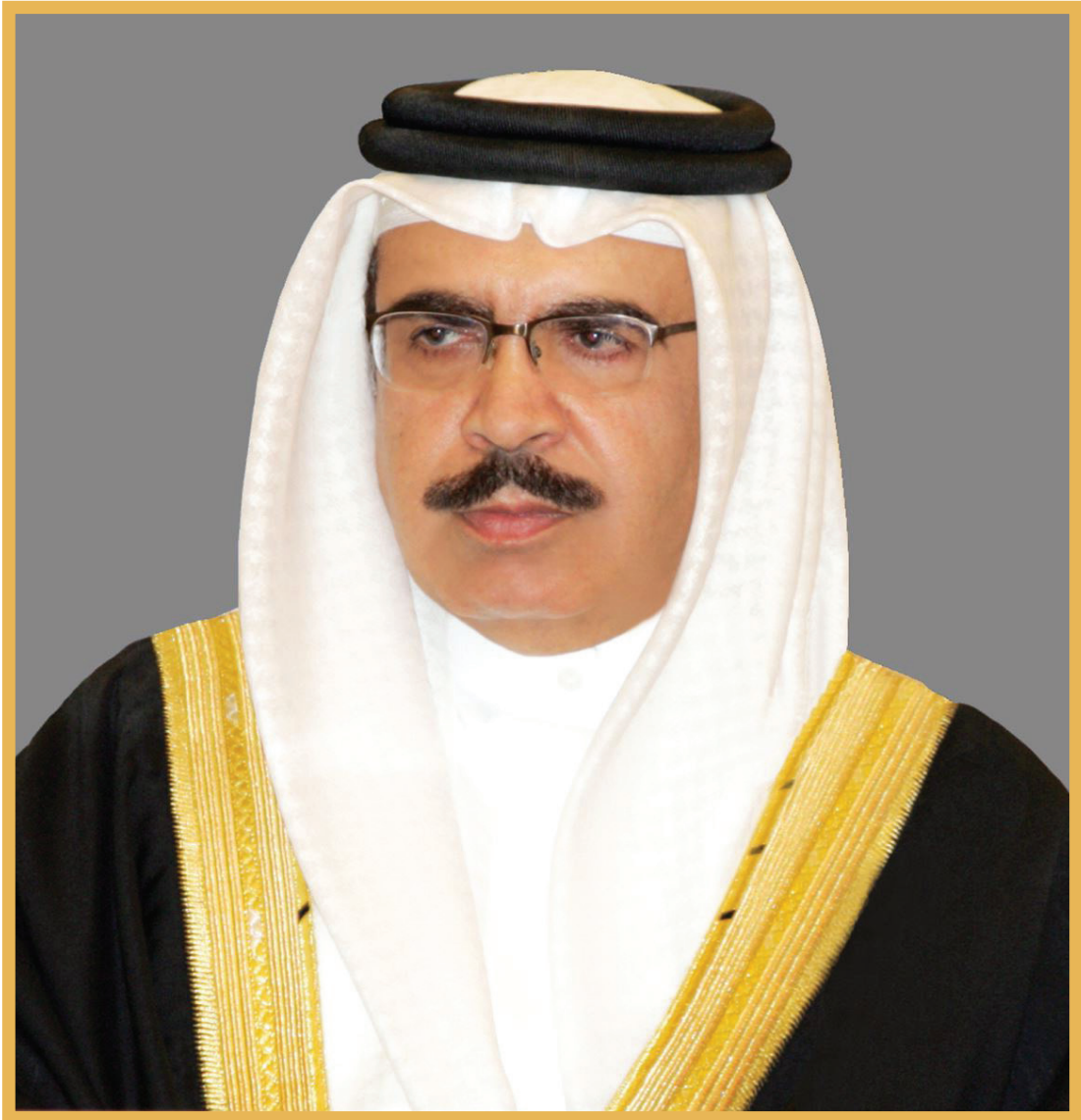
معالي الفريق أول الركن الشيخ راشد بن عبدالله آل خليفة وزير الداخلية