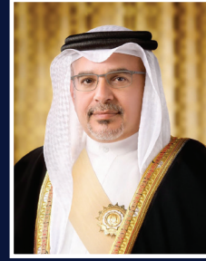
صاحب السمو الملكي الأمير سلمان بن حمد آل خليفة ولي العهد نائب القائد الأعلى رئيس مجلس الوزراء