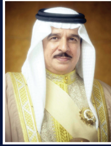
حضرة صاحب الجلالة الملك حمد بن عيسى آل خليفة ملك مملكة البحرين المعظم